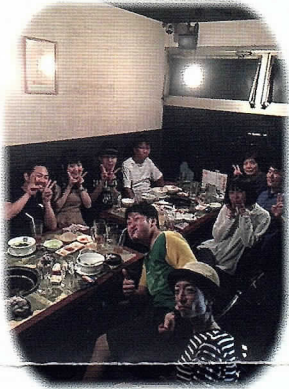
みんなで焼き肉に行った時の 写真です。

京急百貨店駅ビル、ウイング上大岡2階 手軽にできる癒しメニューが豊富なお店です。