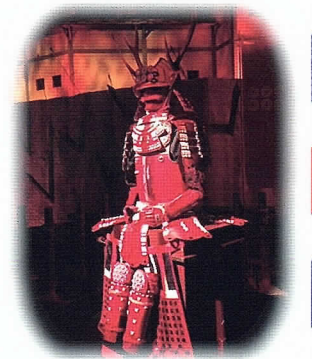
大河ドラマ館。館内はここでしか写真撮影が出来ませんでした。

これで並盛。すごい量でした。右側にあるのがお味噌となめこ。六文銭を彷彿させる様に入っておりました。